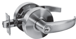
ENTRÉE ENTRÉE/BUREAU BOUTON TOURNANT INTÉRIEUR