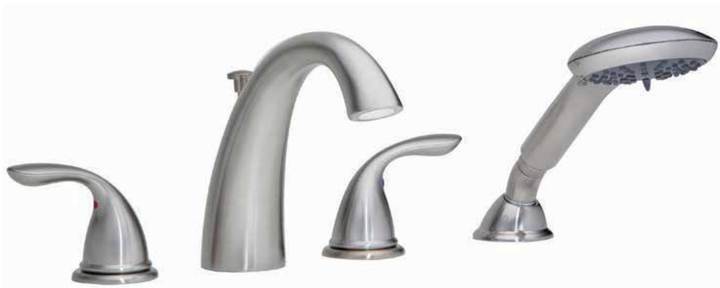
NICKEL SATINÉ PVD

06-4089HS / 06-4089HSSN ROBINET DE BAIGNOIRE ROMAIN