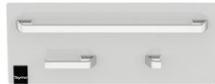
ÉCHANTILLONS D'ACCESSOIRES DE BAIN MONTÉS