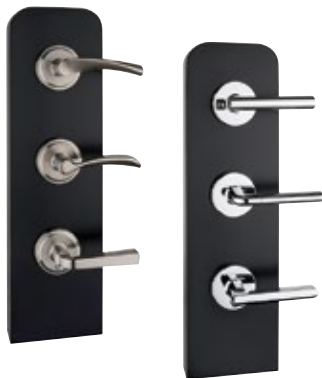
ÉCHANTILLONS D'ACCESSOIRES DE PORTE MONTÉS