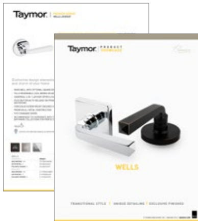
ARGUMENTAIRES DE VENTE ET DOCUMENTS PERSONNALISÉS