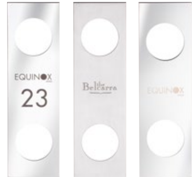
GRAVURE D'ÉCUSSON PERSONNALISÉE