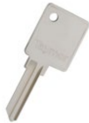
CLÉS AVEC LOGO PERSONNALISÉ