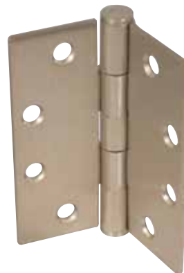
CHARNIÈRE SIMPLE À PALIER LISSE