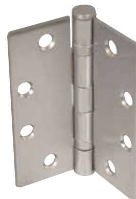
CHARNIÈRE SIMPLE À ROULEMENT À BILLES