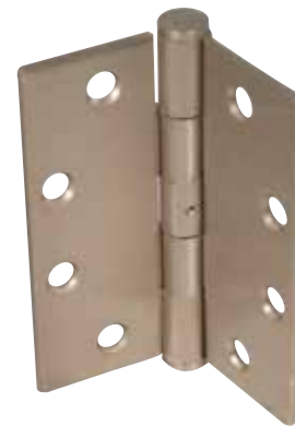
CHARNIÈRE SIMPLE À PALIER LISSE À BROCHE NON AMOVIBLE