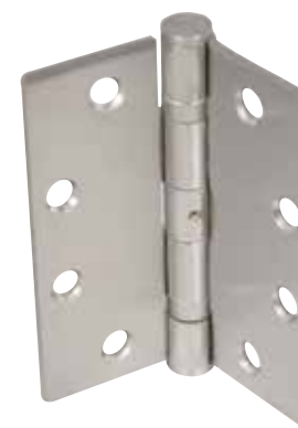
CHARNIÈRE SIMPLE À ROULEMENT À BILLES À BROCHE NON AMOVIBLE